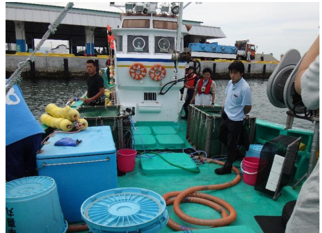
④ 放流海域へ出港 (15:00)