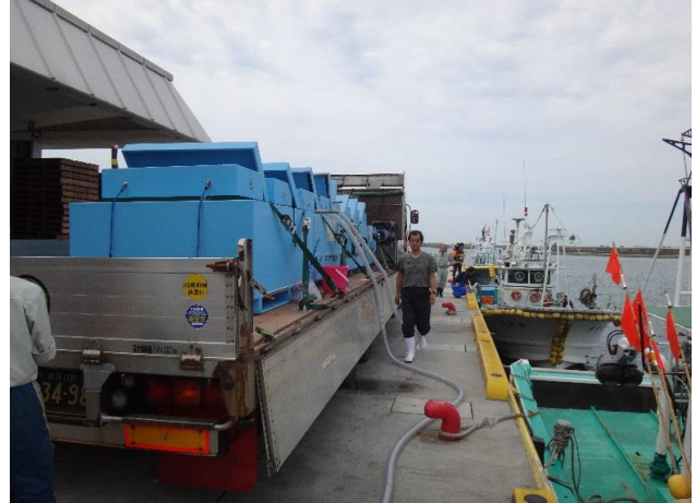
② 放流種苗移送作業 (陸上)