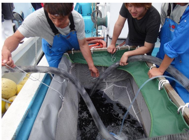
③ 放流種苗移送作業 (船上)