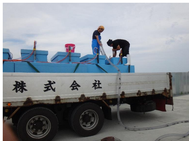
② 放流種苗移送作業 (陸上)