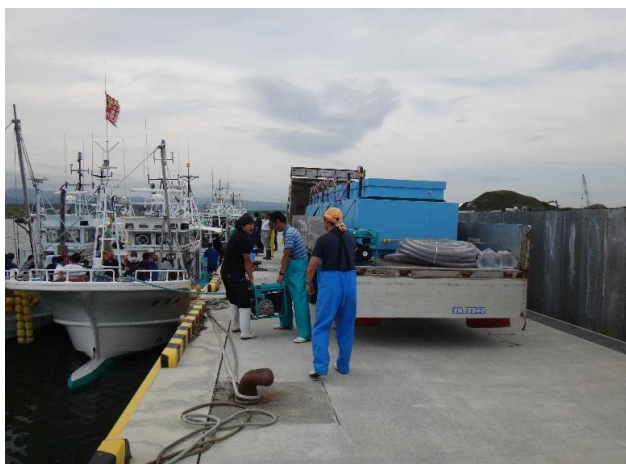
① トラック到着 (14:20)