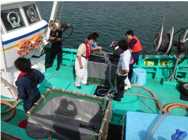
③ 放流種苗移送作業 (船上)