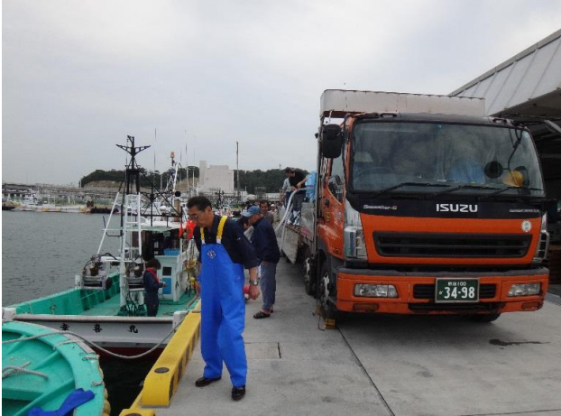
① トラック到着 (14:15)