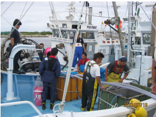
放流種苗移送作業①