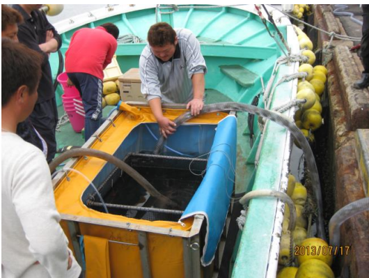
放流種苗移送作業